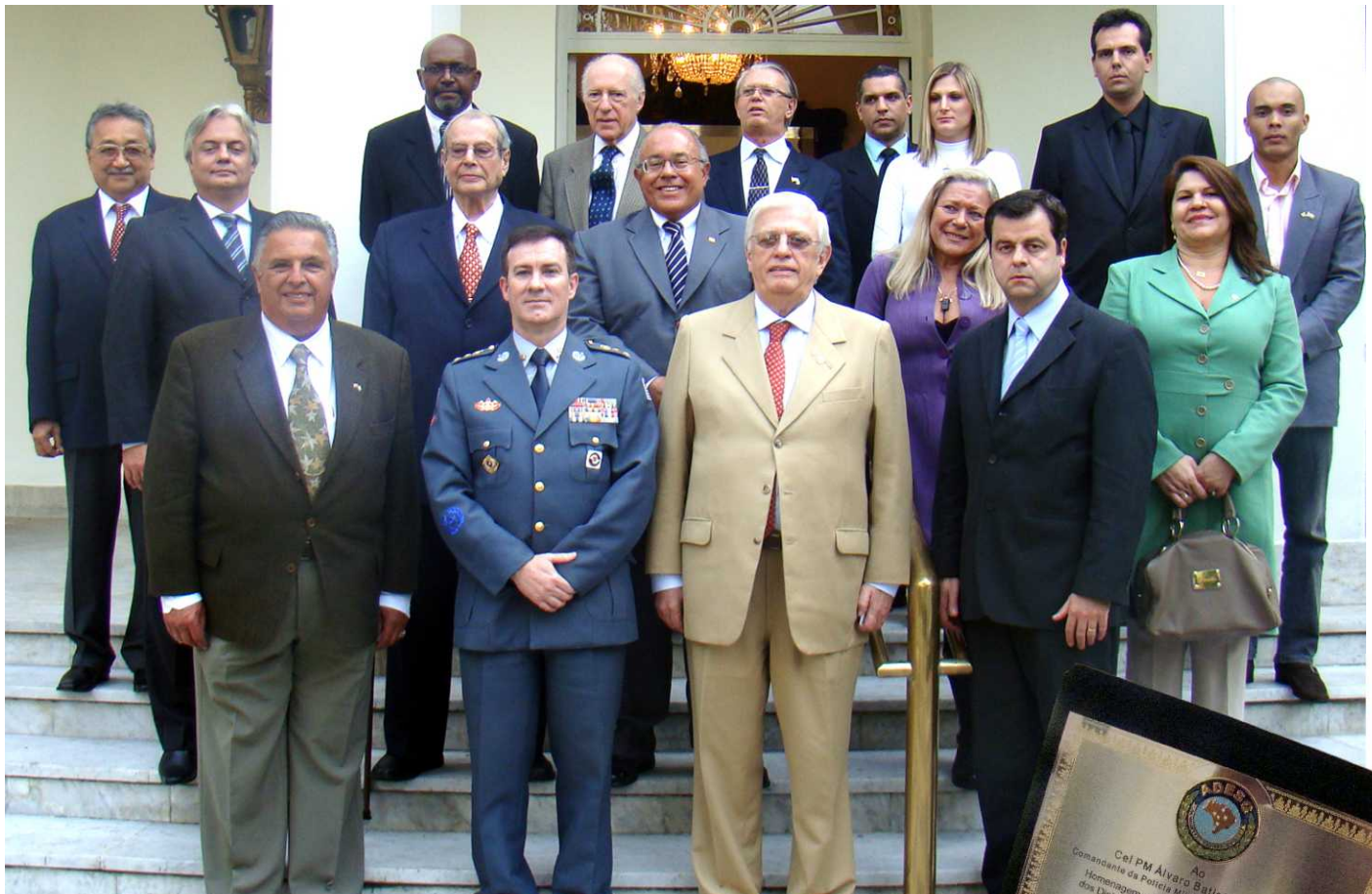
Participantes do Almoço Mensal da ADESG/SP: Clima de integração consolida o sucesso do evento.