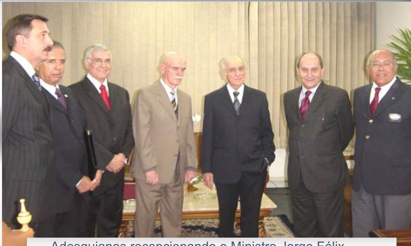
Adesguianos recepcionando o Ministro Jorge Félix