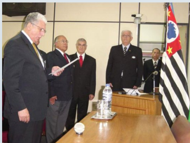
Ato de Homenagem às Bandeiras