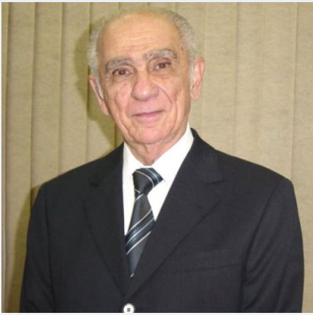
Min. Gal. Jorge Armando Félix na ADESG/SP

No dia 15 de Outubro, o Ministro de Estado Chefe do Gabinete de Segurança Institucional da Presidência da República trouxe com privilégio aos Adesguianos de São Paulo, palestra relacionada a assuntos ligados à Segurança, Inteligência e Prevenção de Drogas. General Jorge Félix destacou ainda a preocupação em proteger as Estruturas Governamentais do País. Confira!